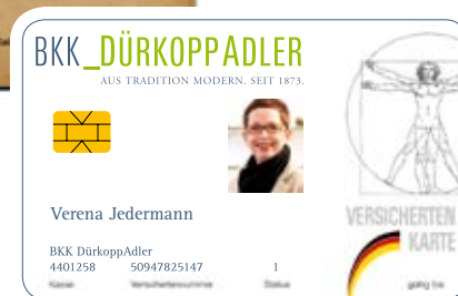
Die moderne Versichertenkarte