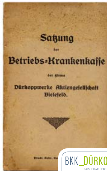
Eine alte Satzung

Damit sicherte das Unternehmen, als eines der ersten in Deutschland, eigene Mitarbeiter im Krankheitsfall ab. In Ostwestfalen ist die BKK DürkoppAdler die älteste betriebsbezogene Krankenkasse, errichtet selbst vor der Einführung der Bismarckschen Sozialgesetzgebung und der gesetzlichen Krankenversicherung im Jahr 1883.